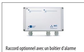
Raccord optionnel avec un boîtier d'alarme